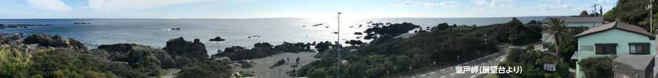
室戸岬(展望台より)