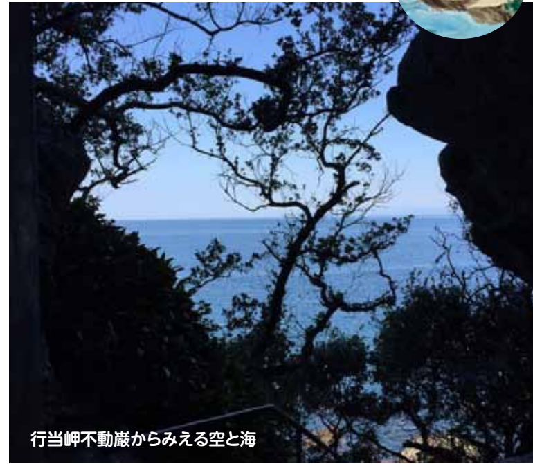
行当岬不動巖からみえる空と海