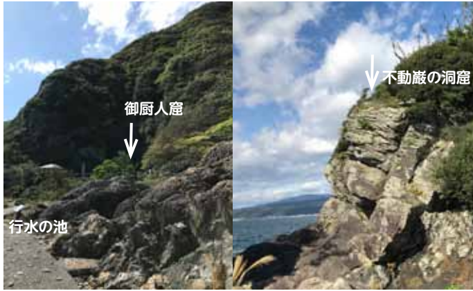
室戸岬の御厨人窟（みくろど）と行当岬（ぎょうどうみさき）の不動巖の洞窟の位置の比較。矢印は洞窟の位置を示す。

室戸は南海トラフに近く、巨大地震が起こるたびに土地が隆起しました。御厨人窟（みくろど）をはじめ、空海が修行を行なった洞窟は現在よりも数m程低い位置だったといわれます。空海修行の霊跡とされる御厨人窟は、現在の海拔10mよりも低く、行水の池あたりの高さだったようです（裏面）。修行のための洞窟にしては海水面に近すぎるのではないかと疑念がもたれています。