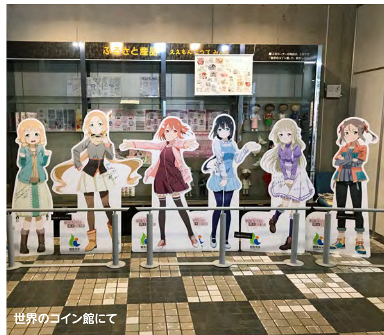
世界のコイン館にて