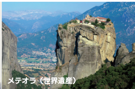
メテオラ（世界遺産）