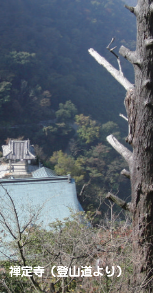
禅定寺（登山道より）