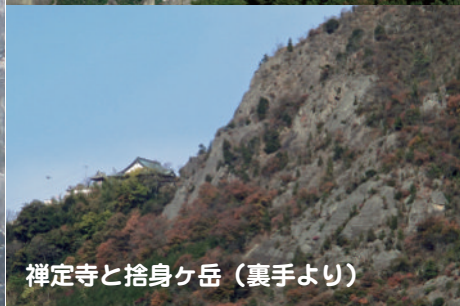
禅定寺と捨身ヶ岳（裏手より）