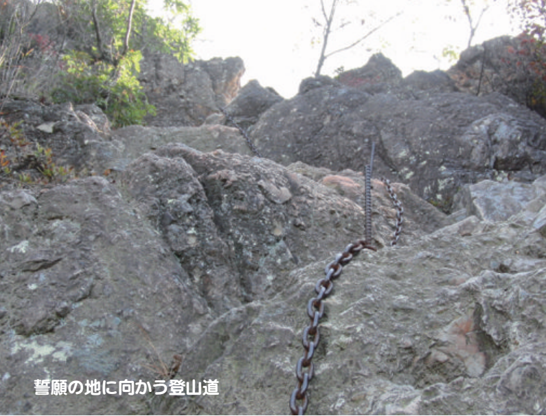
誓願の地に向かう登山道