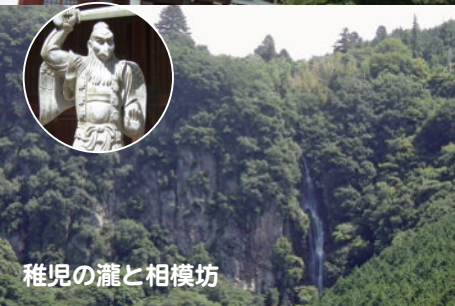
稚児の瀧と相模坊